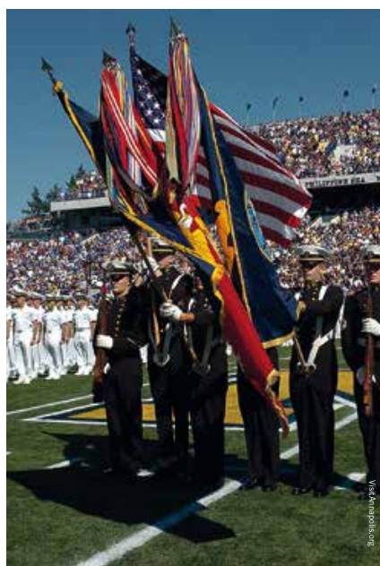
Het American footballteam van de Navy trekt volle stadions