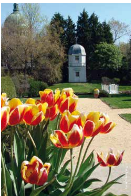
De Paca Gardens zijn vernoemd naar een van de ondertekenaars van de Onafhankelijkheidsverklaring: William Paca

'Vlag, Navy en Annapolis zijn onlosmakelijk met elkaar verbonden'