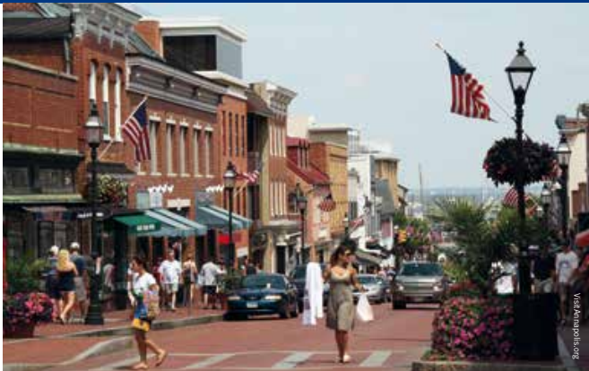
In Main Street barst het van de kroegen, restaurants en boetiekjes