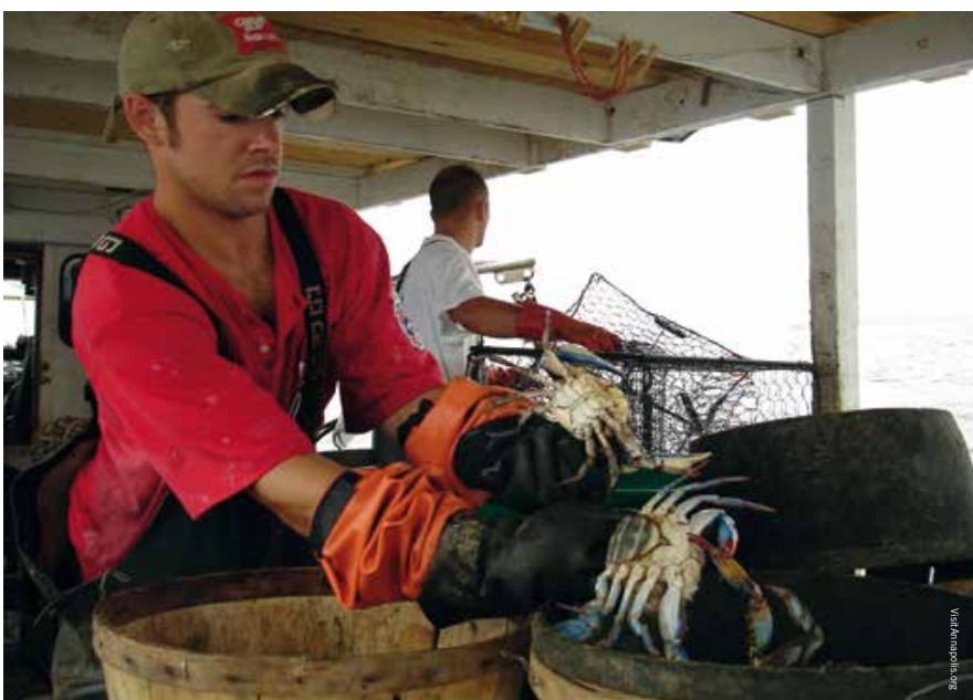
Krab zit hier in het DNA

Het andere hart van Marylands hoofdstad is het State House. Dit uit 1772 stammende regeringsbastion torent net als de Navy Chapel uit boven de straten en stegen van het historische centrum. Het gebouw is het oudste nog in gebruik zijnde congres van de VS. Net als bij de USNA kun je ook hier op vertoon van een ID en na een ontspannen controle zelfstandig rondwandelen. Via marmeren trappen of met een messing lift bereik je de eerste verdieping, waar de trots van Annapolis zich bevindt: een bijna 250 jaar oude handgeschreven tekst met een waarde van 625.000 dollar. Een brief van Washington, George Washington. De twee