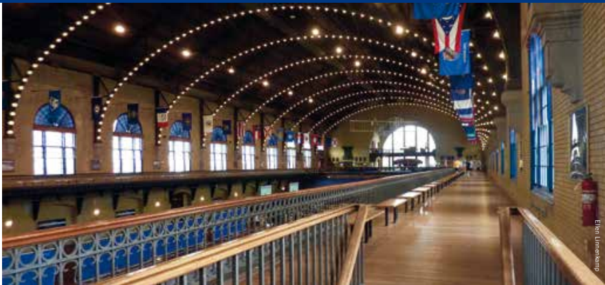
Dahlgren Hall is de voormalige wapen- en munitieopslag van de USNA