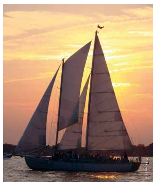
Amerika's sailing capital ligt aan de beroemde Chesapeake Bay