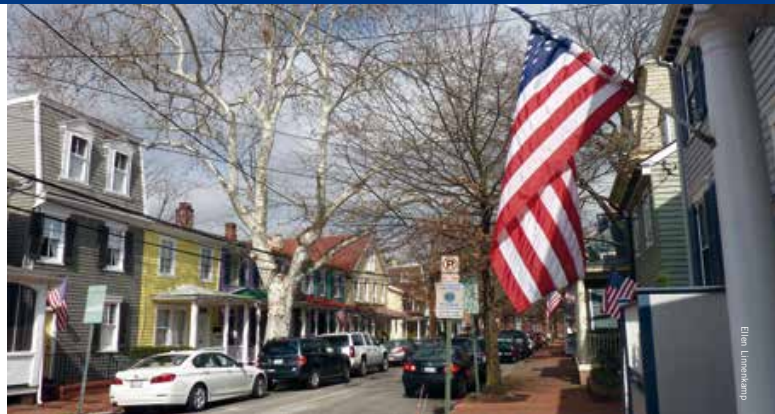
De straten van de hoofdstad van de staat Maryland ademen nostalgie

kantjes oud papier zijn gevangen in plexiglas. Ze zijn beschreven met de afscheidsspeech, die Washington als opperbevelhebber van het Amerikaanse Continentale leger hier op 23 december 1783 gaf. De oorlog met de Britten zat erop en Annapolis was de eerste naoorlogse hoofdstad van de VS geworden. De commander-in-chief – die op 30 april 1789 de eerste president van de VS zou worden – legde voor het congres zijn functie neer.