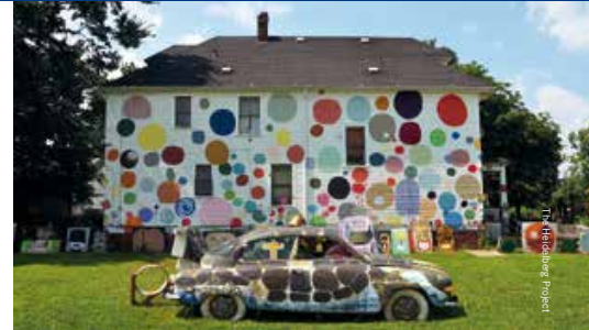
Middelpunt van het kleurrijke universum van The Heidelberg Project: Dotty Wotty House