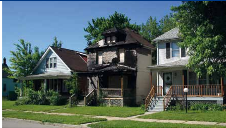
Krotten vol crackverslaafden worden vaak door mensen in de buurt in brand gestoken

straatbeeld. Niet zo vreemd. Dearborn is het hart en de ziel van de Ford Motor Company. Een hart dat nog trots en krachtig klopt. Een ziel die huist op 20900 Oakwood Boulevard. Op dit adres is het Henry Ford Museum gevestigd. Het is een enigszins weemoedige plek waar, naast autogeschiedenis, hoogte- en dieptepunten uit de Amerikaanse geschiedenis worden tentoongesteld. De limo, waarin Kennedy werd vermoord. De stoel, waarin Lincoln werd gedood. De bus waarin Rosa Parks de aanzet gaf tot opheffen van de rassengelijkheid. Het laboratorium van Edison. De werkplaats van de gebroeders Wright. Ford verzamelde het en bracht het samen in het gebouw dat grenst aan Springfield Village, een openluchtmuseum vol historische panden. Iets verderop kun je ook nog terug naar de tijd van popcorn en zoenen op de achterbank bij het grootste nog bestaande drive-incomplex van Amerika: de Ford Drive In. Nog meer geschiedenis, maar dan levend, biedt een bezoek aan de River Rouge Plant. In 1930 zwoegden hier nog negentigduizend zwarte en blanke arbeiders. De paar duizend die hiervan over zijn, sleutelen nu zij-aan-zij met robots pick-uptrucks in elkaar. Bezoekers kunnen de fabriek over een skywalk doorkruisen en zien dat, ondanks alles, de Motor City nog swingt.