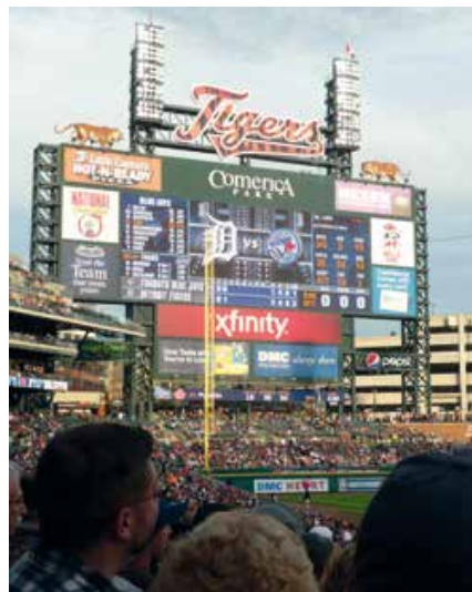
De Detroit Tigers spelen hun wedstrijden sinds 2000 in Comerica Park

Motown in Motor City. Een paar blokken van de plek waar de T-Ford tot leven kwam, symboliseert een gigantische muurschildering de wederopstanding van Detroit. Een gevleugelde tijger is als een feniks opgerezen uit de as. Net als het bakstenen canvas waarop deze mural geschilderd is: het Russell Industrial Center op 1600 Clay Street. Waar verlaten fabrieken zoals de Packard symbool staan voor verval staat deze oude autofabriek voor wedergeboorte. Stukje bij beetje bouwen kunstenaars industrieel verleden om in een creatieve toekomst vol studio's, ateliers en werkplaatsen. Op vrijdag, zaterdag en zondag kun je er terecht voor alles between food and furniture . Terug het verleden van Detroit induikend, kom je vanaf het Russell langs verbrande en verlaten huizen en kerken bij Heidelberg Street. Vanaf 1986 gaat Tyree Guyton hier het verval te lijf met kunst. Ondanks tegenwerking van stadsbestuur, en recentelijk zelfs brandstichting, heeft Guyton van zijn wijk een openluchtkunstinstallatie gemaakt met het Dotty Wotty House als stralend middelpunt van