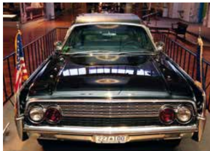
De limo waarin Kennedy de dood vond in het Henry Ford Museum

Na negen innings eten en drinken is fietsen een gezonde en relaxte manier om de stad verder te ontdekken. Omdat de mensen zijn vertrokken en de brede wegen zijn achtergebleven, hebben fietsers de ruimte. Eén lane voor de fiets, twee voor de auto. Buiten de spits zou dit ook andersom kunnen zijn. Het centrum, inclusief het imposante GM Renaissance Center, de oevers van de Detroit River en het tussen de Verenigde Staten en Canada ingelegene Belle Isle. Alles ligt op minder dan een half uur trappen van Wheelhouse Detroit aan het net opgeknapt Riverfront. Op de route naar Belle Isle ligt