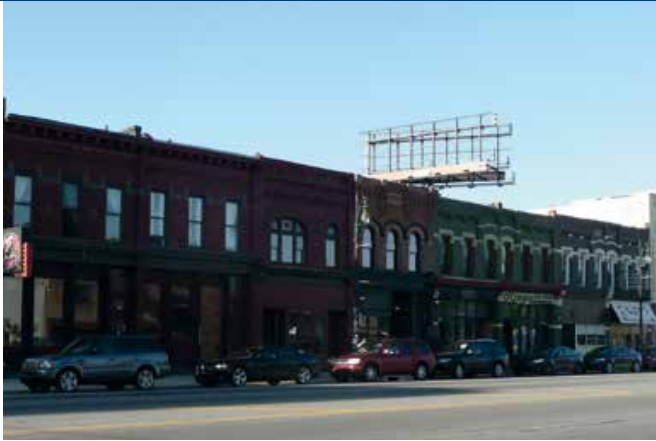
Corktown met links Slows en daarnaast Honor & Folly