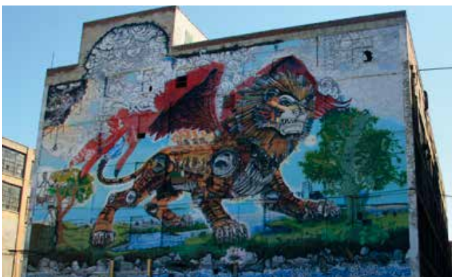
The Russel Industrial Center – broedplaats herrezen uit as van autofabriek

Dichter bij Dearborn knapt het stadsbeeld op. Er verschijnen meer en meer Fords in het