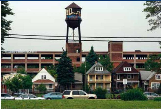
Wonen tussen vervallen industriële glorie