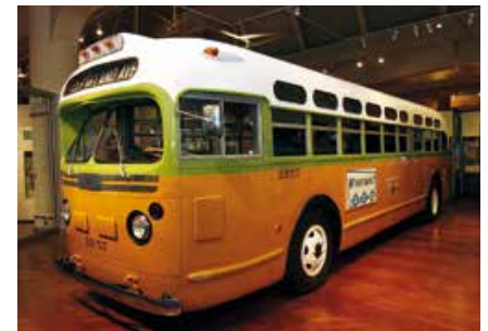
De bus, waarin Rosa Parks het begin van het einde van de rassongelijkheid in gang zette

Andrews on the Corner. Dit bijna honderd jaar oude familie instituut heeft de hele geschiedenis van Detroit op 201 Joseph Campau Street aan zich voorbij zien trekken. Met een beetje geluk loopt de eigenaar rond en wordt ontbijt, lunch of diner geserveerd met de geschiedenis van Andrews en Detroit als bijgerecht. Op Belle Isle werpt de oude – en natuurlijk verlaten – dierentuin van Detroit haar schaduw over zeeën van woekerend groen. Wie goed luistert, kan het gekrijs en gebrul van de verdwenen bewoners nog horen. Net als de lach van ouders en hun kinderen. Echo's uit het verleden. Een verleden dat in Detroit nooit ver weg is.