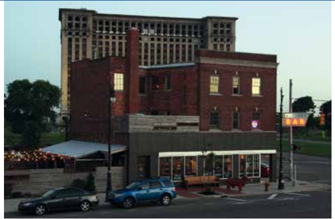
Uitzicht op Mercury Bar en Michigan Central Station vanuit Honor & Folly

Wie via de Ambassador Bridge oversteekt van Canada naar de Verenigde Staten stapt in een tijdmachine. Achter je ligt Windsor, the city of Roses . Een stad met een van de laagste criminaliteitscijfers van Canada. Met een bloeiende economie en vertrouwen in de toekomst. Voor je ligt Detroit. Amerika's murder capital number 1 . Getekend door bakstenen littekens. Waar de toekomst slechts een groeiende kloof is met een illuster verleden. Maar een van Detroit's muzikale kinderen, Eminem, zong het al: "Look, if you had one shot, or one opportunity. To seize everything you ever wanted. One moment. Would you capture it or just let it slip?" Wie de stad bezoekt, voelt het. Creativiteit die borrelt onder versteend verleden. Energie die knettert. Frisgeverfde gevels tussen verkoelde skeletbouw op de begraafplaats van Amerika's eerste post-moderne stad. Detroit pakt haar laatste kans. Er is hoop voor de metropool. Hoop, die niet schuilt in schrikbarende statistieken, maar woont in de harten van de pioniers van de 21ste eeuw.