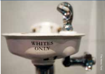
Amerika's racistische verleden gevangen in breekbaar porselein in het Henry Ford Museum