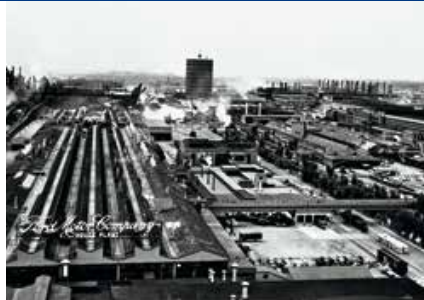
's Werelds bekendste autofabriek in haar hoogtijdagen