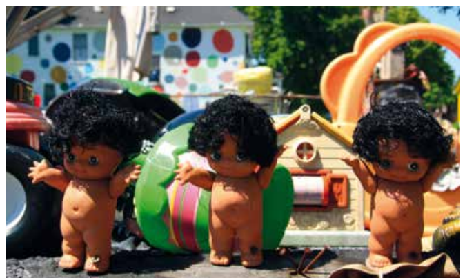
The Heidelberg Project is een artistiek baken in Detroit's zee van ruïnes