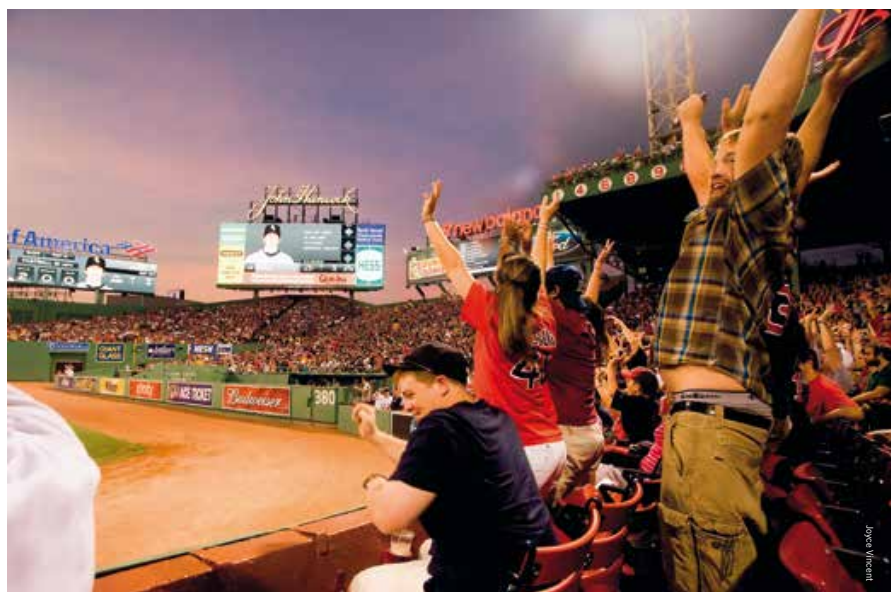
Uit je dak bij Fenway Park