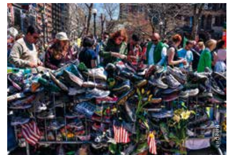
Al snel ontstond dit bijzondere herdenkingsmonument

zingen, want vanwege de ziekte van Parkinson is hij per direct gestopt met zijn carrière. Op 30 oktober 2013, zes maanden na de aanslag, winnen de Boston Red Sox de World Series. So Good, So Good, So Good .