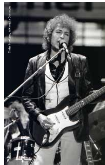
Optreden in De Kuip in Rotterdam op 4 oktober 2008