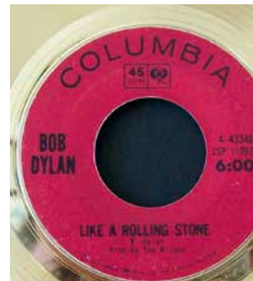
De single werd een groot succes