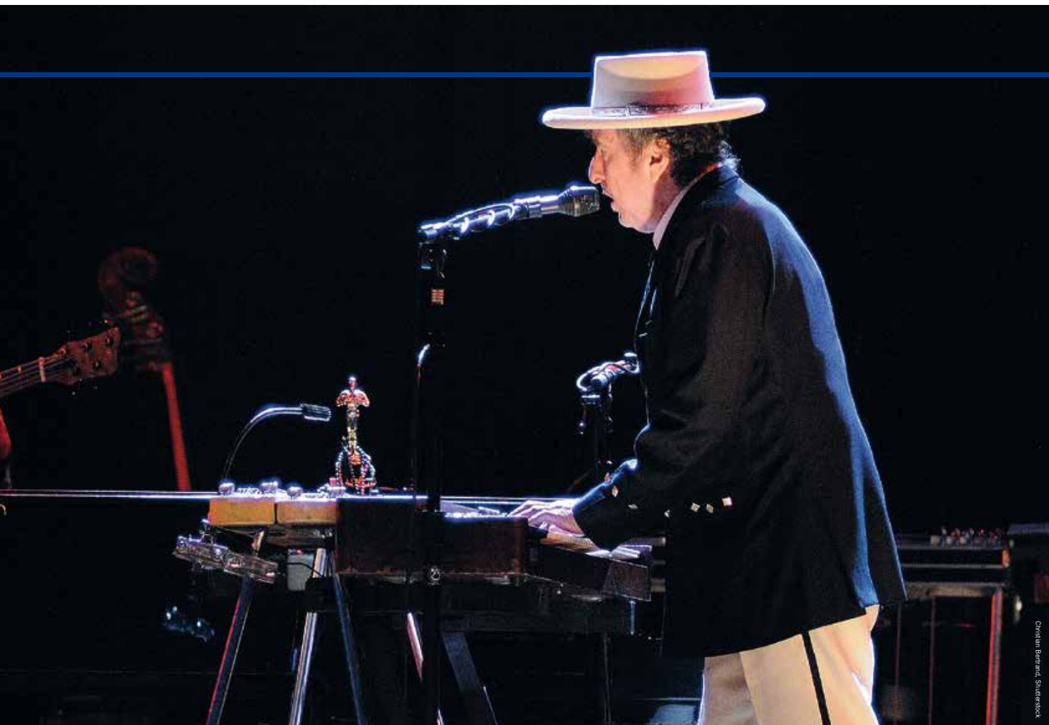
Christian Bernard, Shutterstock

Bob Dylan tijdens een optreden in juli 2013 in Benicàssim, Spanje