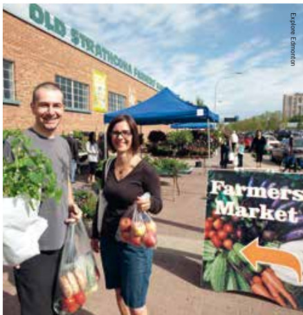
Alles vers op de Old Strathcona Farmers' Market

Farmers' Market – Elke zaterdag is het kijken, proeven, kopen op de Farmers' Market.