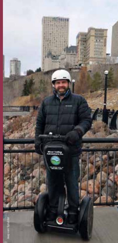
Jasper van Spilniter

In de volgende AmericA nemen we je mee naar buiten. Kun je niet wachten dan zijn dit vast wat tips voor een (hele) frisse neus in Edmonton en Jasper. Dwars door Edmonton stroomt de North Saskatchewan River. Van de River Valley is een park gemaakt, dat maar liefst 22 keer zo groot als Central Park is. Je kunt hier met gemak een dag wandelend, fietsend of zelfs op een Segway (www.rivervalleyadventure.com) doorbrengen. Verruil je de stad voor de bergen, dan kom je onderweg naar Jasper langs de Miette Hot Springs. Een duik in deze warme bronnen moet je natuurlijk eerst verdienen. Bijvoorbeeld door de Sulphur Skyline Hike te lopen en jezelf na een pittige klim met een 360-gradenuitzicht op de Rockies te belonen voordat je in bad gaat: www.hikejasper.com/ Hike-Jasper-Sulphur-Skyline.