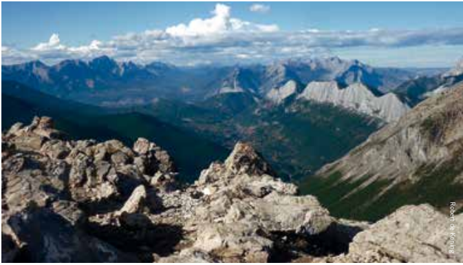
Geen bloed, wel zweet en (geluks-)tranen op de top van de Sulphur Skyline Hike