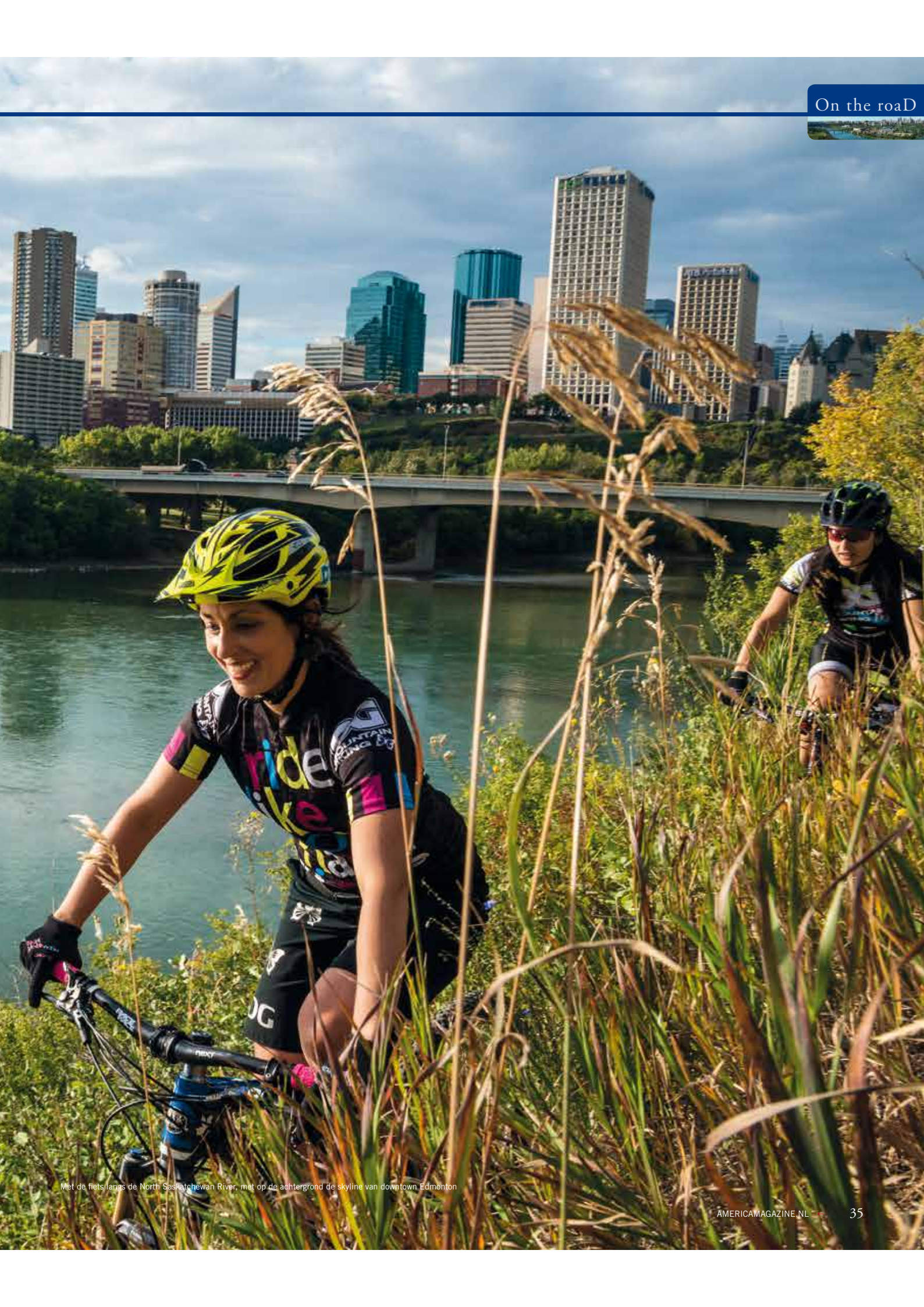
Met de fiets langs de North Saskatchewan River, met op de achtergrond de skyline van downtown Edmonton