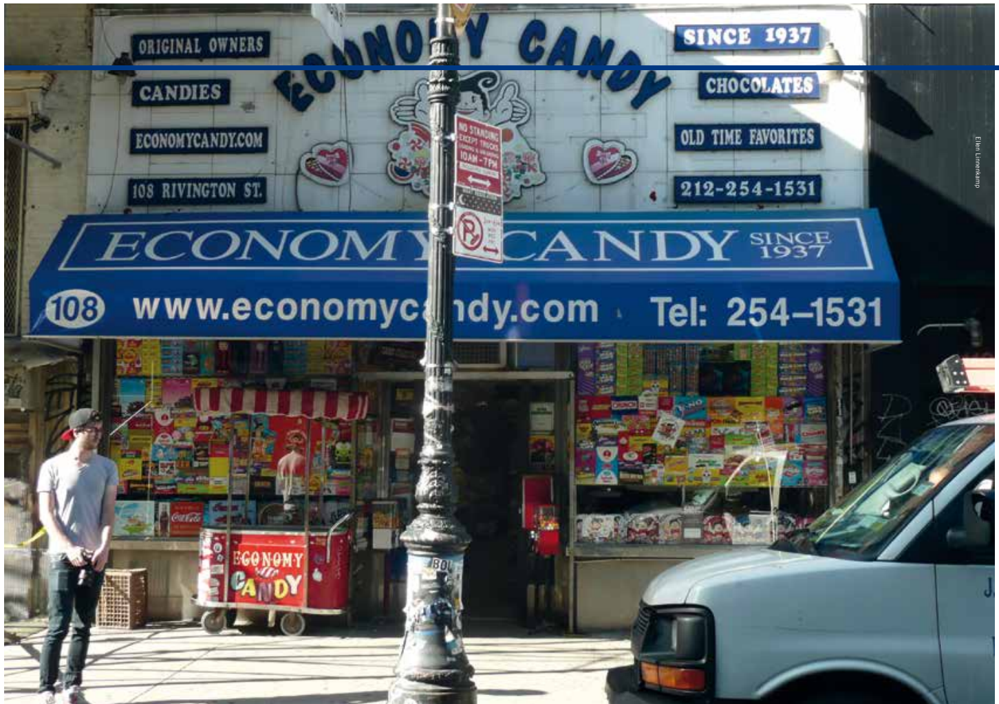
De gevel van Economy Candy