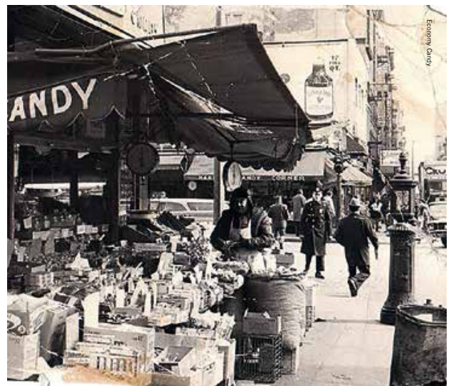
Economy Candy in de jaren vijftig van de vorige eeuw