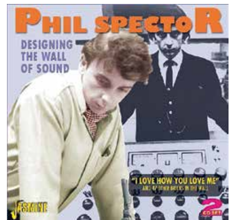
Phil Spector was de uitvinder van The Wall of Sound