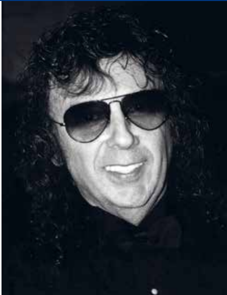
Phil Spector in 2000