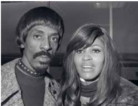
Ike en Tina Turner

Het was John Lennon die hem uit zijn prepensioen haalde. Lennon en Spector kenden elkaar nog uit de hoogtijdagen van The Beatles. De producent zat in het vliegtuig dat de Fab Four voor het eerst naar Amerika bracht. Met Instant Karma en Imagine bewees hij 'het' nog in de vingers te hebben. En met het allerlaatste album van The Beatles, Let it Be , leverde Phil Spector wederom een meesterwerk. De legend was back , maar trok zich een paar jaar later wederom terug in een château in Los Angeles.