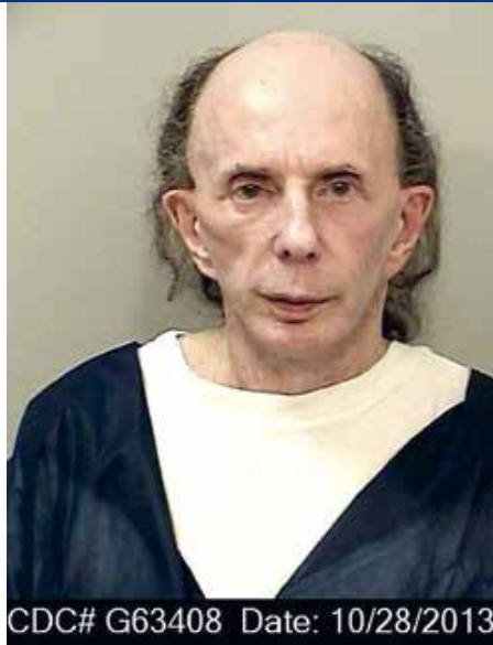
Een mugshot van Phil Spector

42 keer namen The Ronettes Be my baby op. Uit losse flarden tekst en instrument, vlocht hij in de studio een symfonie. Het unieke geluid gaf 'teenage angst' een stem. In 1965 nam hij met The Righteous Brothers de hit You lost that loving feeling op. Daarna braken Ike & Tina Turner de studio af. De producer verwachtte met hen zijn Magnus Opus te creëren. Maar River Deep, Mountain High strandde op nummer 88 in de Billboard 100. Zwaar teleurgesteld sloot hij zich op in zijn huis in Beverly Hills. De gordijnen gingen dicht. Phil Spector ging met pensioen. Hij was 25 jaar.