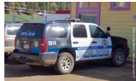
911 in plaats van 112

'Nederland zou Nederland niet zijn als er van dit bizarre verhaal geen feestje werd gemaakt'