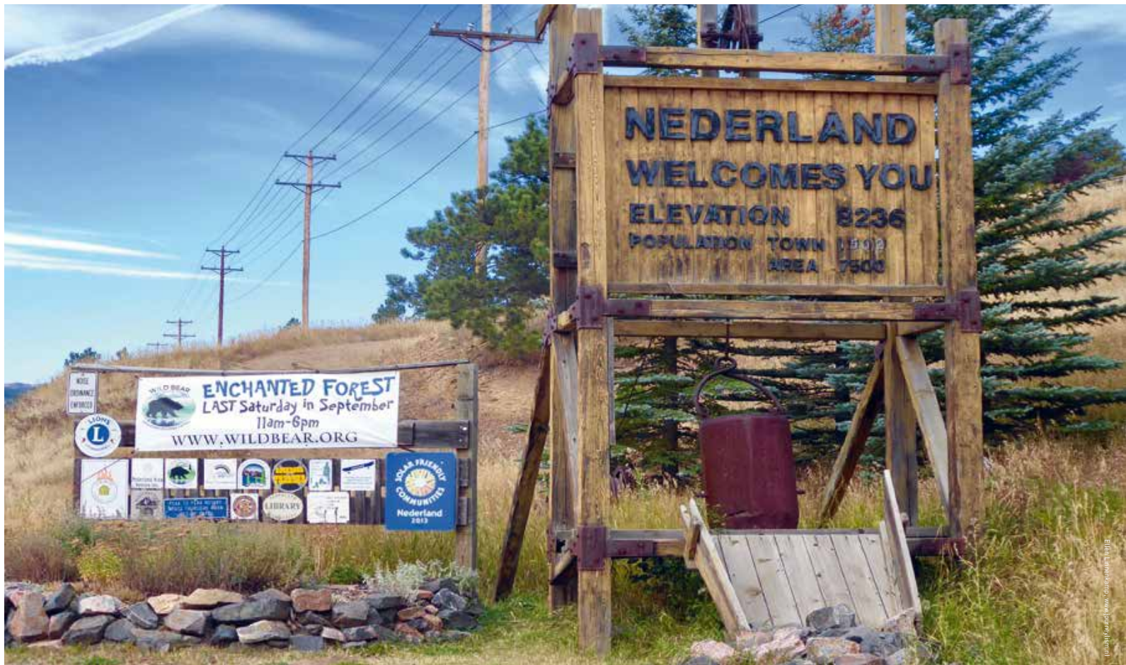
Exclusief Opa Breido telt het dorp 1502 inwoners