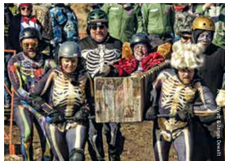
Ren je rot

Wie buiten de Bevroren Dode Man Dagen Nederland bezoekt, waant zich, afhankelijk van de seizoenen, in een aards buitensportparadijs. 's Winters kan er worden geskied. In het voorjaar