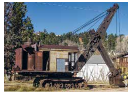
Mijnbouw is nu verleden tijden

ontluikt de natuur met iedere stap die je zet op een van de vele wandelroutes. 's Zomers geeft de berglucht verkoeling tijdens het mountainbiken. En in het najaar zet de herfst een verulde kroon van bladeren op het oude zilverbijstadje. Na een paar dagen chillen tussen vijftiendhonderd levende en één dode Ned Hed , kunnen we beamen dat er meer is tussen een 2.508 meter hoge hemel en 6,76 meter-onder-NAP-aarde. Life is better up here , is het motto van Nederland. Amen.