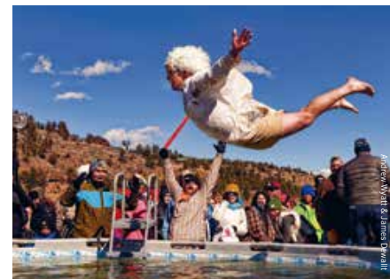
Met wat geluk vriest het niet tijdens de Frozen Dead Guy Days