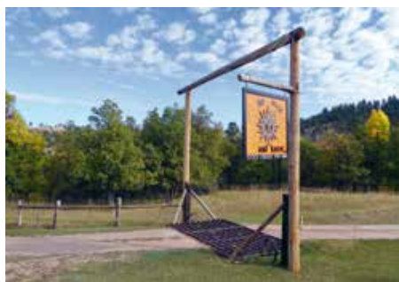
AmericA's bed & breakfast