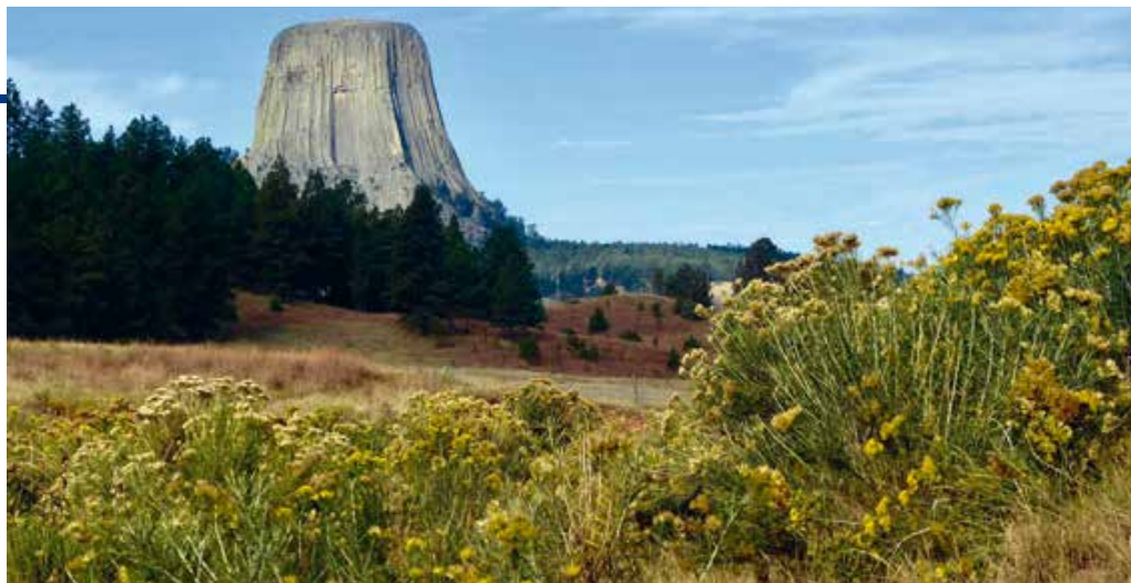
Devils Tower is een fotomodel met ontelbare gezichten