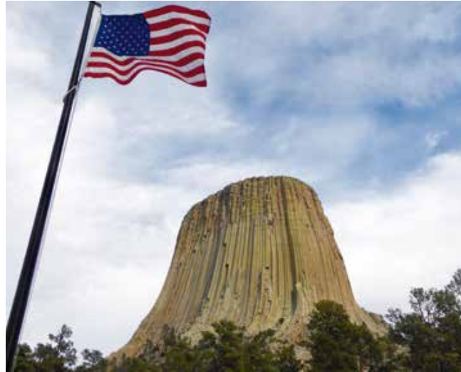
Devils Tower National Monument

De soundtrack van Generatie X werd verzorgd door MTV. De videoclip door Steven Spielberg. In een tijdspanne van zeven jaar leverde de Amerikaanse regisseur drie iconische speelfilms af. Jaws , Close Encounters of the Third Kind en E.T. the Extra-Terrestrial bestormden tussen 1975 en 1982 de bioscopen. En net als bij Richard Dreyfuss in Close Encounters , heeft de aantrekkingskracht van Devils Tower ons sinds het zien van de film niet meer losgelaten. Als we rijdend over WY-24 links aan de horizon de berg zien opdoemen, zijn we behalve door schoonheid ook verblind door jeugdsentiment.