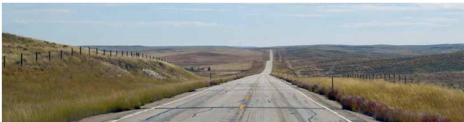
We're on a road to nowhere...