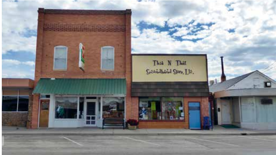
Douglas is een spookdorp waar nog wat leven in zit