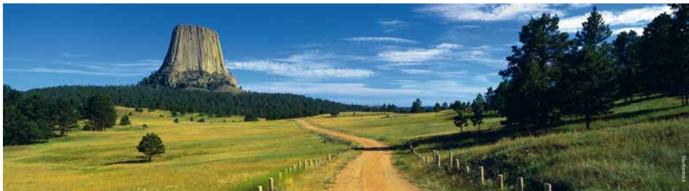
Het laatste stuk naar Devils Tower

Devils Tower is een National Monument dat de bezoeker veel te geven heeft. Natuurlijk is er de ‘butte’ zelf, die werd gevormd door miljoenen jaren erosie van de omliggende ‘zachte grond’. Maar er is meer. Wilde kalkoenen scharrelen