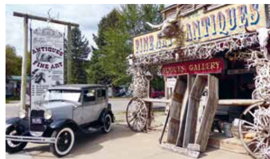
Rogues Gallery in het wildwest stadje Hulett