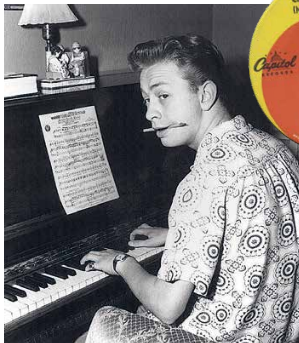
Melvin Howard Tormé