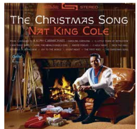
Je komt al meteen in de kerstsefeer

'Nat was King. Eén van de meest invloedrijke jazzmuzikanten van zijn tijd'