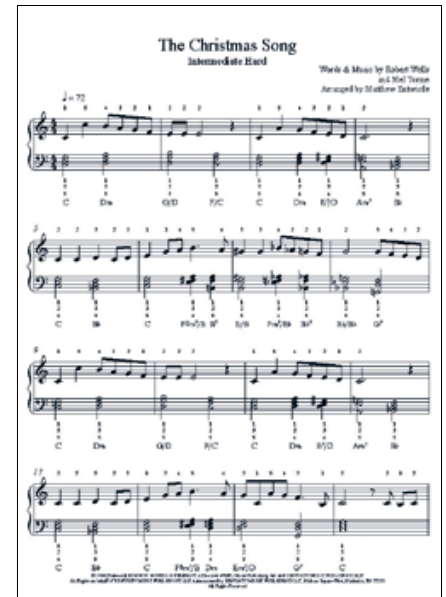
Voor als je het zelf wilt spelen

'De stem die The Christmas Song aan de wereld gaf, behoorde toe aan Nathaniel Adams Coles, alias Nat King Cole'