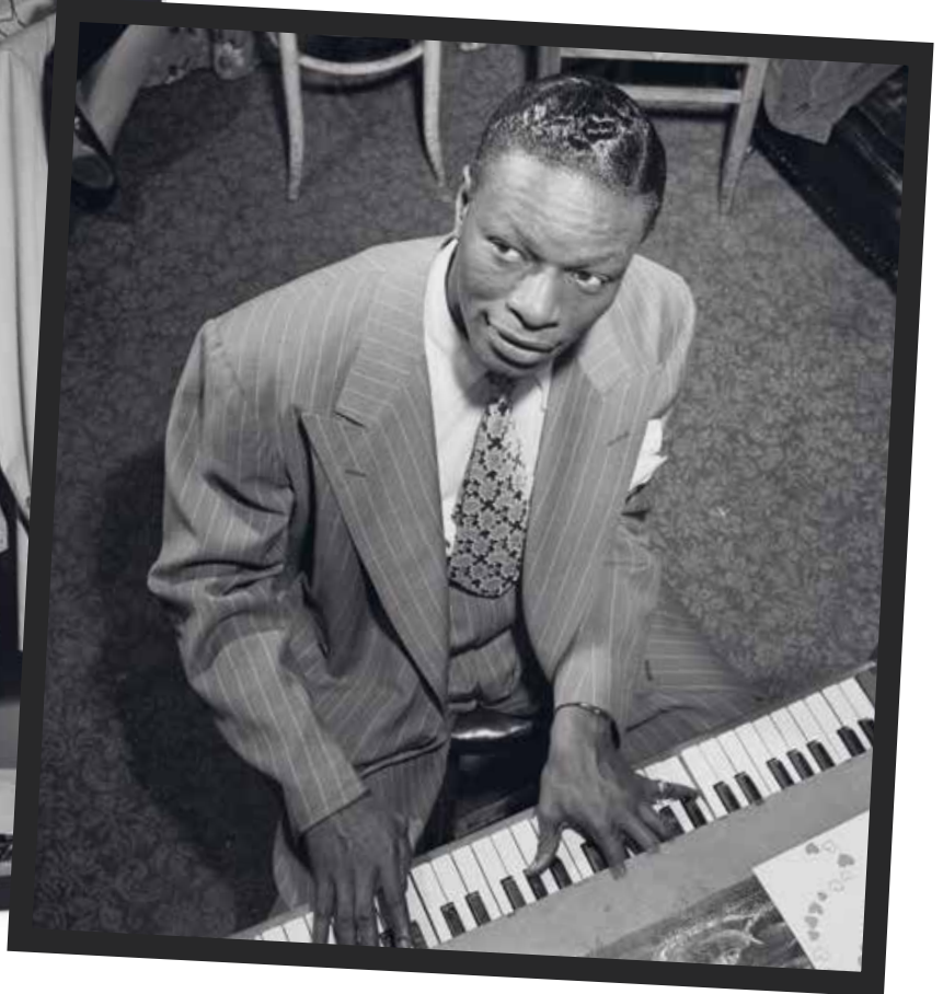
Nat King Cole in 1946... en in 1947