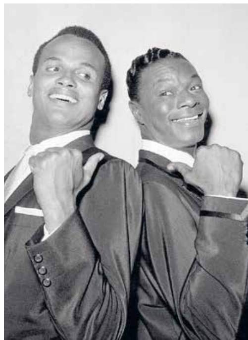
Samen met die andere icon: Harry Belafonte