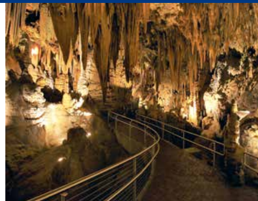
Een half miljoen bezoekers dalen jaarlijks af in de wonderde wereld onder Virginia

Verderop in de onderaardse gewelven voelen we ons bespied door een blik zonder ogen. In het halfduister van de Skeleton Gorge kijken we naar de dodendans tussen schaduw en licht. Zo'n vijfhonderd jaar geleden zakte hier een indianenmeisje door de bodem van haar graf.