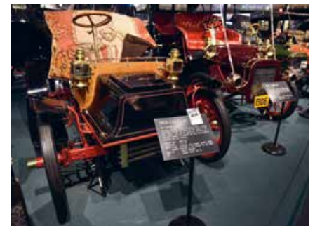
Car & Carriage Museum