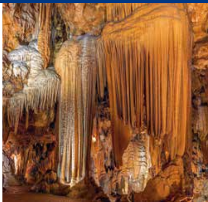
De ziel van de aarde met druipsteen geboetseerd