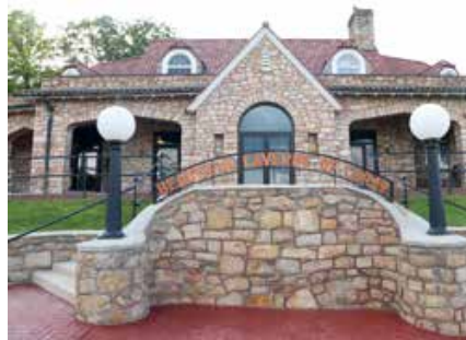
Eerst even een kaartje kopen

De caverns liggen bij het gelijknamige, in 1812 gestichte Luray. Aan de overenthousiaste omschrijving van Luray, voegde de Kamer van Koophandel in 1922 ook nog een overzicht van de plaatselijke middenstand toe. Het stadje telde naast 1.381 inwoners drie hotels, vijf pensions, een loodgieter, twee juweliers, twee drukkerijen, een krant, twaalf (!) drogisterijen, een theater