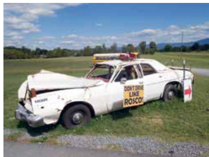
Je komt van alles tegen langs de Stonewall Jackson Highway

annex filmhuis en vier kappers. Het lijkt wat veel van het goede, maar sinds de ontdekking van de nabijgelegen grotten, trok het gehucht tienduizenden bezoekers. Anno 2019 verdwijnen er jaarlijks een half miljoen mensen onder de grond. En als ze boven komen, zien ze net als AmericA dat de juweliers zijn vervangen door kringloopwinkels en de drogisterijen hebben plaatsgemaakt voor for sale of rent borden. Op het eerste gezicht lijkt dit een typisch voorbeeld van het verval van Main Street USA . Maar lopend richting de zuurstokroze bioscoop, blijkt er toch leven in de brouwerij te zijn. Restaurants, een sjieke Imm en zelfs een patisserie ademen hoop. Hoop op een nieuwe gouden eeuw voor Luray. Een gouden eeuw die begon op 13 augustus 1878.