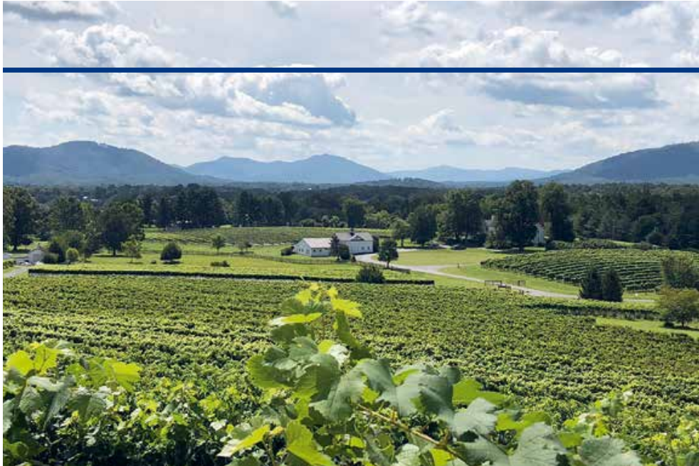
Wijngaard aan de voet van de Shenandoah

In 1922 noemde de plaatselijke Kamer van Koophandel 'Luray de Koninginnestad van Page Valley', en schreef men lyrisch over 'het meest lieflijke, pittoreske stukje van de Shenandoah dat even vruchtbaar, vredig en gezagsgetrouw als mooi is'. Men voegde hieraan toe dat 'De Page Valley een bevolking heeft die bekend staat om haar intelligentie, deugdzaamheid en de strikte naleving van zowel de wetten van God als van het land'. Het is een bloemlezing waarvan de lokroep moeilijk is te weerstaan. Dus reist AmericA af naar deze parel aan de South Fork van Virginia's Shenandoah River om te zien hoe de zaken er, boven- en ondergronds, een eeuw later voor staan.