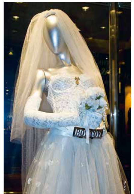
De trouwjurk van Like a Virgin is te zien in een van de Hard Rock cafés