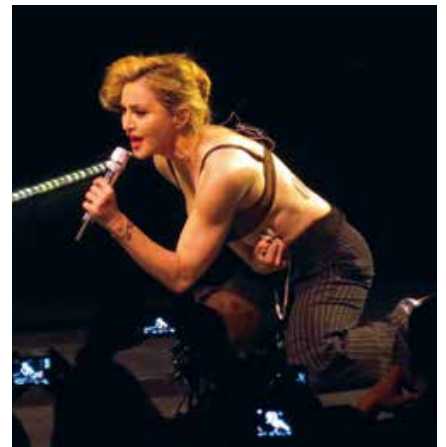
Madonna op de MDNA Tour in Seattle in 2012