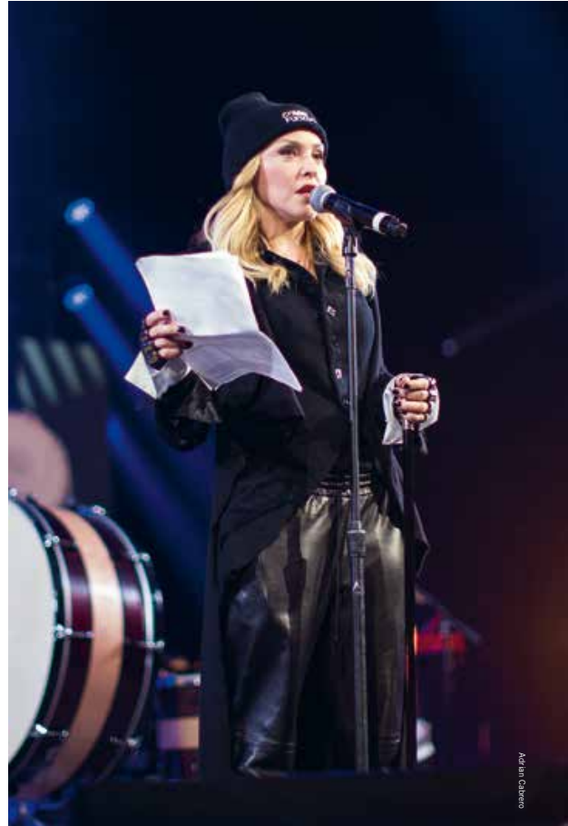
Madonna als activist in 2014 tijdens het Bringing Human Rights Home-concert van Amnesty International