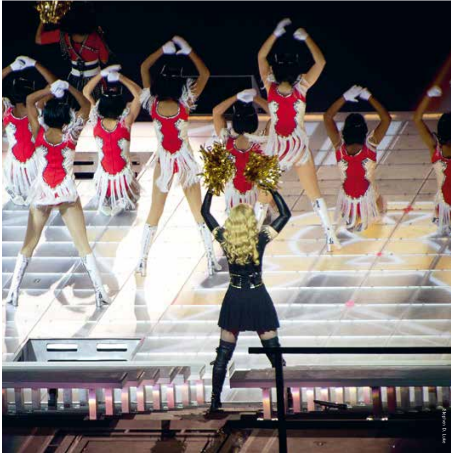
Tijdens de Super Bowl Halftime Show in 2012