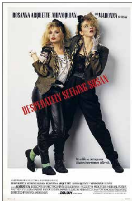
In Desperately Seeking Susan

"Kunst moet controversieel zijn, that's all", zei Madonna dertig jaar geleden tegen de New York Times naar aanleiding van alle commotie rondom Like a Prayer . De katholieke kerk excommunicerde haar, Pepsi cancelde commercials en haar tourneesponsoring, hele volkstemmen waren boos en gechoqueerd. In de video brandden kruisen, was Madonna intiem met een (zwarte) heilige en werd een onschuldige, donkere man opgesloten voor aanranding. Ze schopte tegen heilige huisjes. Hield een spiegel voor. Voor veel Amerikanen was het te veel. Toch bereikte Like a Prayer een eerste plaats in de hitparade. De boodschap kwam aan en over. "Dichterbij kunst kan popmuziek niet komen", schreef Rolling Stone Magazine . Toen het stof was neergedwarreld, kwam Madonna met Justify my Love . "Poor is the man, whose pleasures depend, on the permission of another", verschijnt aan het eind van de video in beeld. Een Material Girl laat zich de mond niet snoeren.