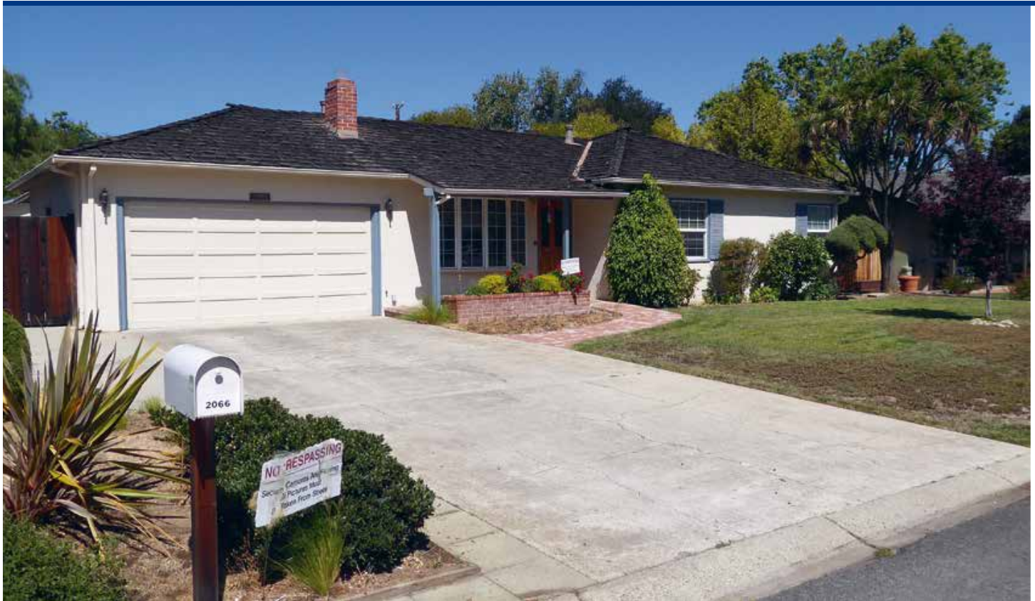
Bij Steve Jobs' voormalige residentie: NO TRESPASSING