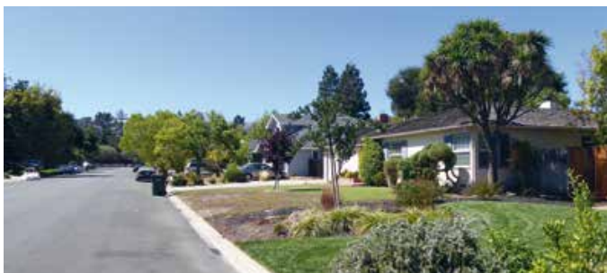
Crist Dr. is een rustige straat waar je als kind lekker buiten kunt spelen (of kunt solderen in je garage)

TEKST → ROBERT DE KONING (JOURNEYLISM.NL)