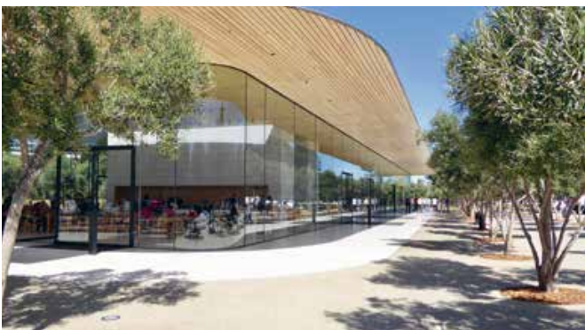
Apple zou Apple niet zijn als aan het uiterlijk van de winkel geen zorg en aandacht zou zijn besteed