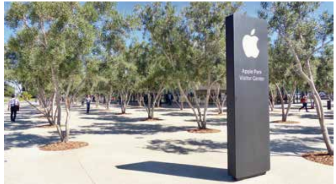
(Olijf-)Bomen en ander groen onttrekken de gebouwen deels aan het zicht