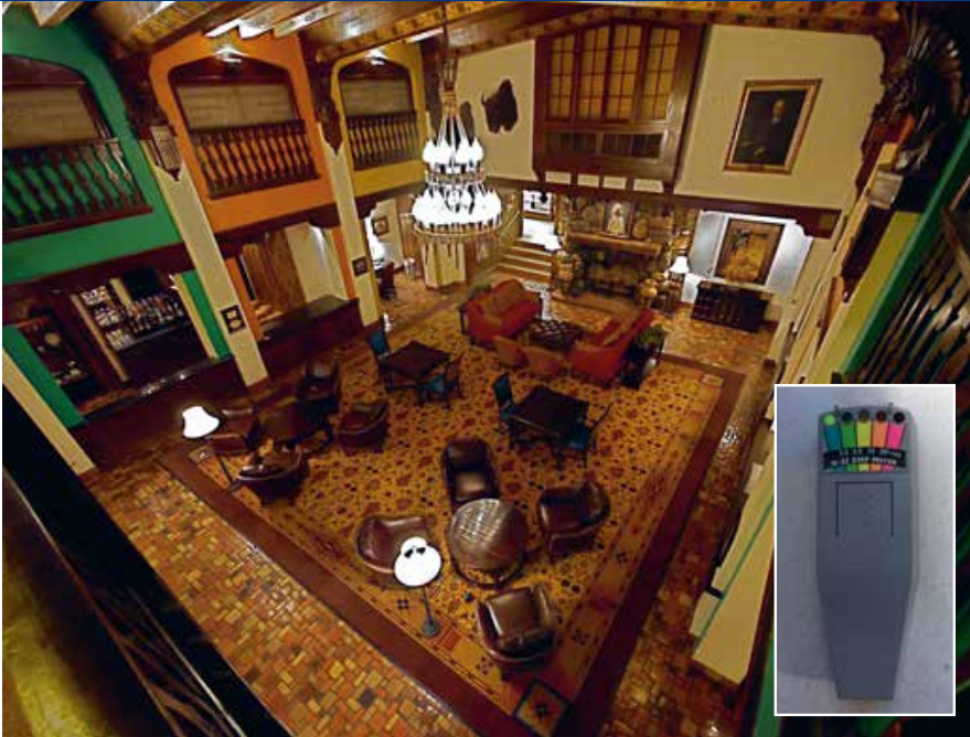
Wie heel goed kijkt vindt ingemetselde swastika-tegeltjes in de vloer