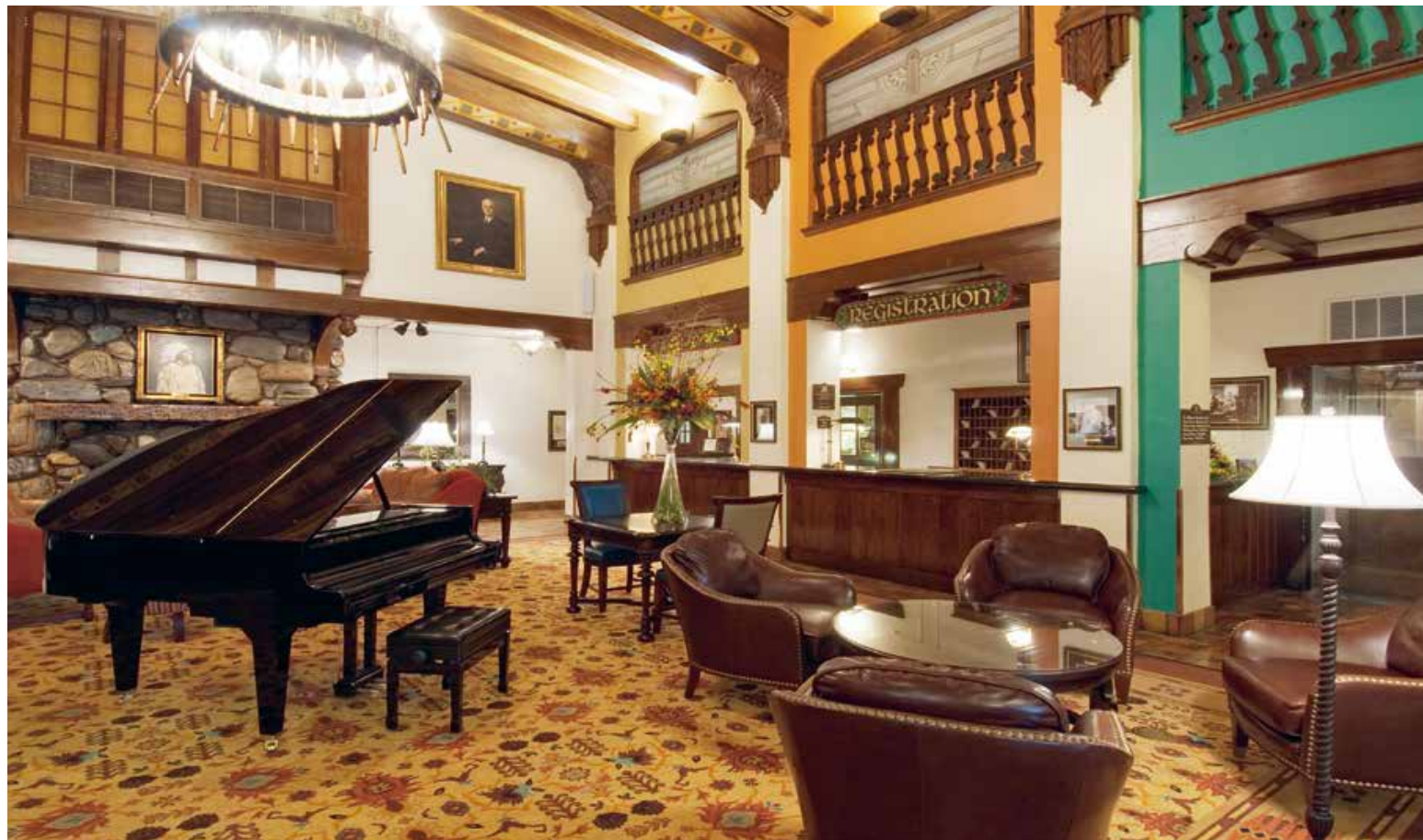
Sioux-elementen in de lobby van Hotel Alex Johnson