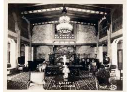
The showplace of the West

'Hun paranormale activiteiten veranderden de pleisterplaats in South Dakota's most haunted hotel '