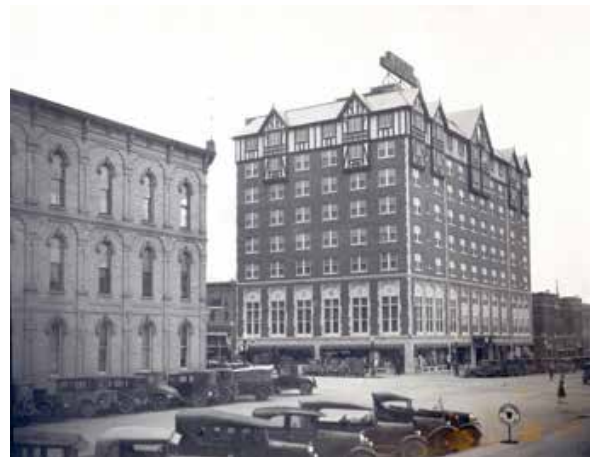
Het hotel in de beginperiode, nog in zwart-wit