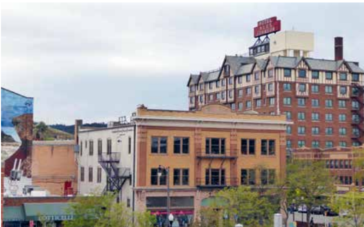
Opgetrokken in Tudorstijl domineert The Alex Johnson Rapid City's skyline