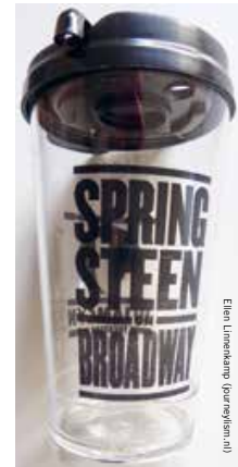
Vijftien dollar (exclusief tax) kostte een bierje bij Springsteen op Broadway, maar dan mocht je het 'glas' wel houden