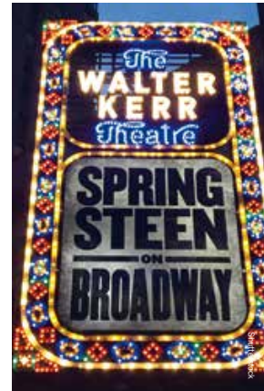
Walter Kerr Theatre

'Born in the USA onderging na het uitbrengen een metamorfose van protest- tot volkslied'