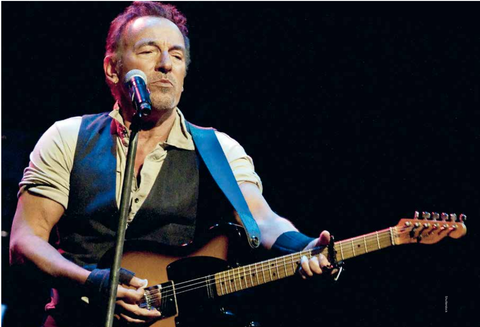
Bruce The Boss Springsteen