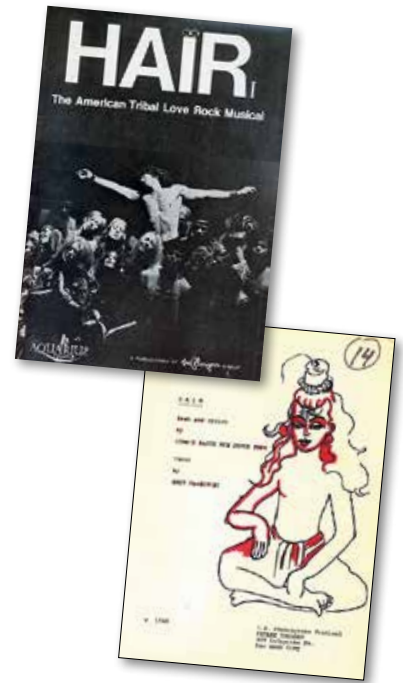
Het originele programmaboekje en het originele theaterscript

‘De heren struinden de straten, clubs en cafés van de East Village af op zoek naar jongeren met lang haar’