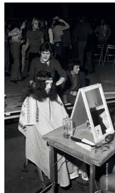
In Nederland werden ook kapperwedstrijden georganiseerd voor het beste Hair -kapsel