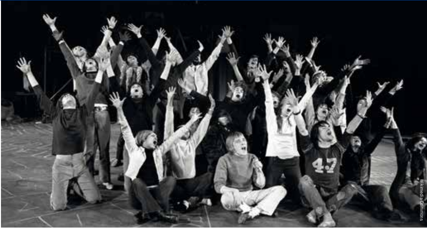
Voorpremière van de musical in Nederland, november 1969