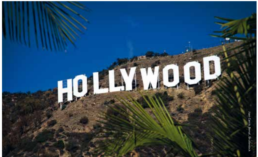
Hollywood Sign: Sterren kijken op Mt. Lee

Los Angeles is Hollywood en Hollywood is sterren. Een van de sterren die in Hollywood is neergestreken is het Griffith Observatory. Een art-decopaleis, dat met dank aan een gift van Colonel Griffith J. Griffith in 1935 aan het firmament van Los Angeles verscheen. Het observatorium werd ontworpen door architect John C. Austin en gebouwd op Mount Hollywood. De omgeving, het interieur en exterieur zijn een lust voor het oog. Net als de gratis toegankelijke tentoonstellingen, een blik in de ruimte door de tachtig jaar oude Zeiss-telescoop en, in afwezigheid van smog, een onbelemmerd uitzicht van downtown L.A. tot aan de Pacific. Dankzij haar bijzondere architectuur en locatie wordt het