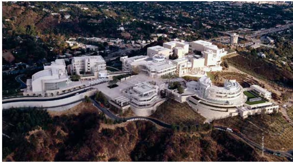
Getty Center: een kunstwerk van 1,3 miljard dollar

Amerika is een land vol filantropen. Dankzij de passie, energie, tijd en het geld van de mannen en vrouwen die the American Dream droomden, staan er door het hele land in steen gehouwen gulle giften. Het Griffith Observatory, de Walt Disney Concert Hall en het Getty Center zijn voorbeelden van wat een mecenas voor de ontwikkeling van een stad(-sdeel) kan betekenen. Een van de gulle gevers van L.A. is Jean Paul Getty. Getty was in de jaren zestig van de vorige eeuw, met dank aan olie, de rijkste man ter wereld. Maar meer nog dan om zijn fortuin stond hij bekend om zijn passie voor kunst en om zijn krenterigheid. In een van zijn huizen liet hij volgens de overlevering een payphone plaatsen voor gasten en Getty wilde toen zijn kleinzoon werd ontvoerd in Italië maximaal $2,2 miljoen losgeld betalen - een hoger bedrag was niet van de belasting aftrekbaar. Pas na zijn dood in 1976 liet de oliebaron zijn andere kant zien. Een derde van zijn fortuin, een bedrag van $661 miljoen, en zijn hele kunstverzameling vormden de basis van wat is uitgegroeid tot 's wereld rijkste kunstfonds: het J. Paul Getty Trust. Om het verzamelde werk van Getty, de nieuwe aankopen, de educatieve en wetenschappelijke doelstellingen