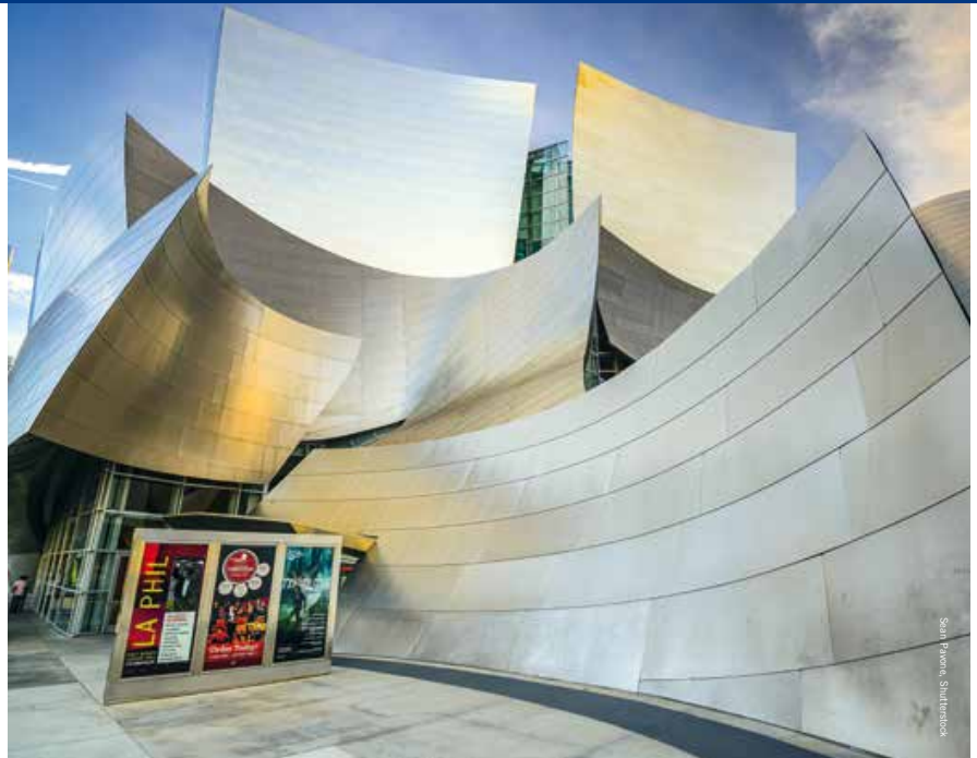
Walt Disney Concert Hall

Dankzij Walt Disney is het ooit dode centrum van Los Angeles gereanimeerd. Zijn Concert Hall is een voorbeeld van de revitaliserende kracht van architectuur. Een nieuw icoon voor downtown L.A., geschonken door Disneys weduwe en van de hand van een andere rektantafellegende: Frank Gehry. Binnen wordt het oog uitgedaagd, terwijl het oor wordt verwend. De akoestiek van het gebouw, dat wordt bespeeld door het LA Philharmonic, is in perfecte balans met haar esthetiek. Een balans, die bij de opening van het gebouw in 2003 voor omwonenden werd verstoord, toen bleek dat het als een brandspiegel werkte, van appartementen sauna's maakte en het trottoir deed smelten. Als eerbetoon aan mevrouw Disney staat op een van de terrassen van het vrij toegankelijke exterieur van de Music Hall een smashing kunstwerk van kapotgeslagen Delfts Blauw in de vorm van een reusachtige bloem.