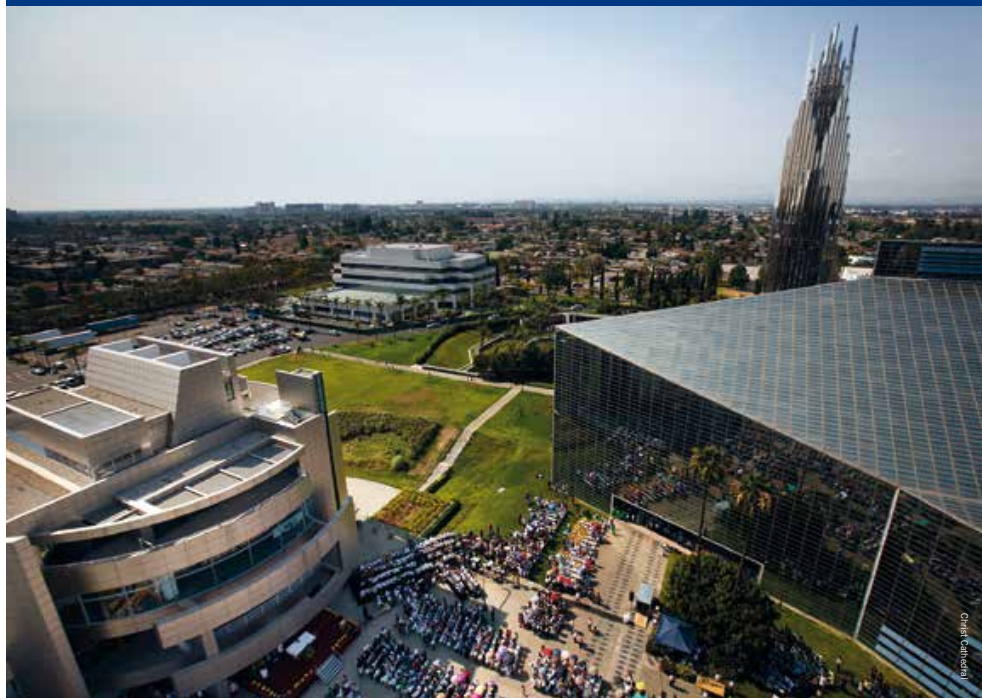
Crystal Cathedral: een waanzinnig groot complex

‘Na hoogtepunten als het Griffith Observatory, de Walt Disney Concert Hall en het Getty Center is de Crystal Christ Cathedral ondanks, of misschien wel dankzij haar goddelijke extravagantie een fonkelend sieraad in de architectonische juwelenkist van Los Angeles’