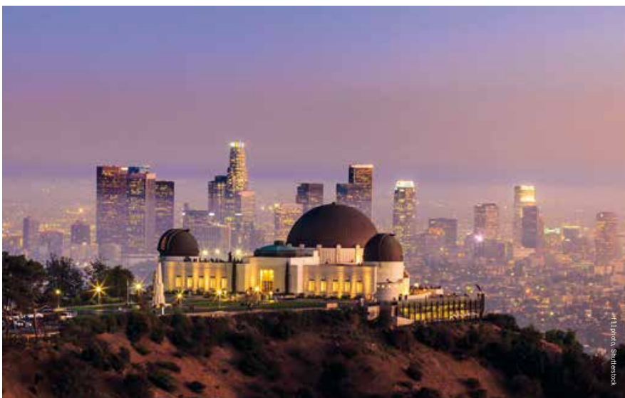
Het Griffith Observatory is prachtig gelegen

The roaring twenties waren ook voor de Amerikaanse filmindustrie een roerig tijdperk. Zwart-wit werd ingekleurd en stomheid werd geslagen toen in 1926 Don Juan in première ging, de eerste film met geluidseffecten en muziek. Een jaar na de opening van Grauman's Chinese Theatre in 1927 werd Mickey Mouse 'geboren' en was Hollywood definitief de kraamkamer van een miljardenindustrie geworden. De magie van de film werd in die jaren versterkt door de thematische architectuur van de bioscopen. Net als Tuschinski in Amsterdam was Grauman's Chinese Theatre een plek waar je, ook wanneer er geen film werd vertoond, je fantasie de vrije loop