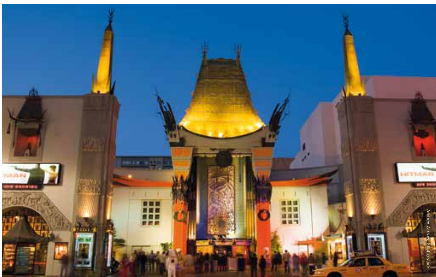
Het Tuschinski van Hollywood: TCL Chinese Theatre

‘De zandkleurige gebouwen worden omhelsd door de adembenemende tuinen van Robert Irwin en gekust door vergezichten over L.A.’