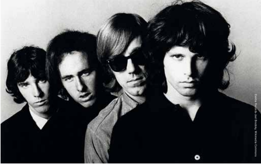
Jim Morrison met de rest van The Doors: John Densmore, Robby Krieger en Ray Manzarek