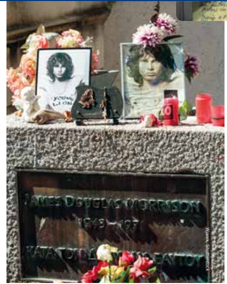
De laatste rustplaats van Jim Morrison: Père Lachaise in Parijs