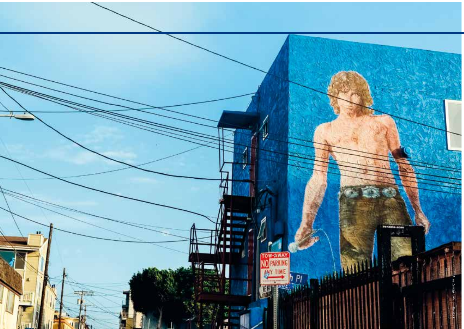
In Venice Beach wordt Jim Morrison nog steeds op handen gedragen