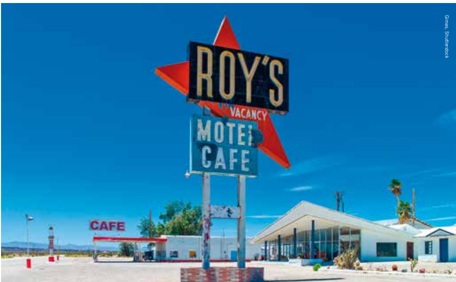
Roy's aan Route 66 is een van de filmlocaties van The Hitcher

Hoewel ze relatief kort hebben bestaan, is de invloed van de The Doors op de Amerikaanse (pop-)cultuur groot. Popcritici zien de band als een van de belangrijkste vertegenwoordigers van de counterculture. Iedere tien tot vijftien jaar lijkt de kenmerkende klank van de groep opnieuw te worden ontdekt. Door nozems, hippies, provo's, generatie X, Y en Z, en millennials.