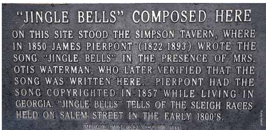
Hier was het echt

'Medford is de bron waaruit de moeder aller kerstliedjes ontsprong'