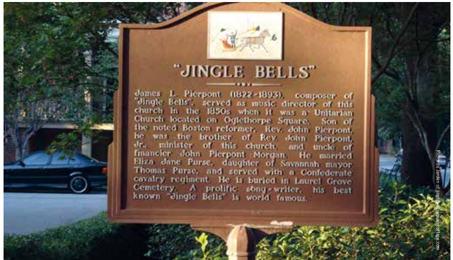
De claim to fame in Savannah tegenover de kerk van James Pierpont