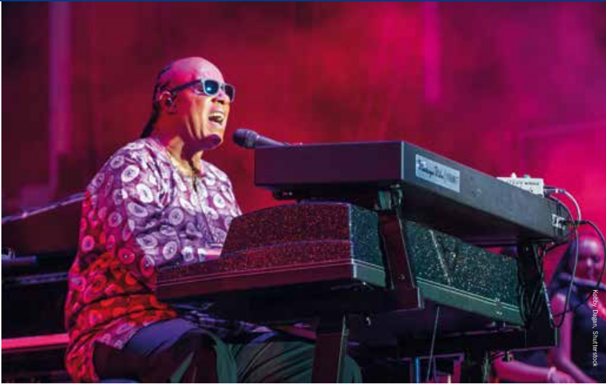
Stevie Wonder op het podium in Las Vegas in 2015