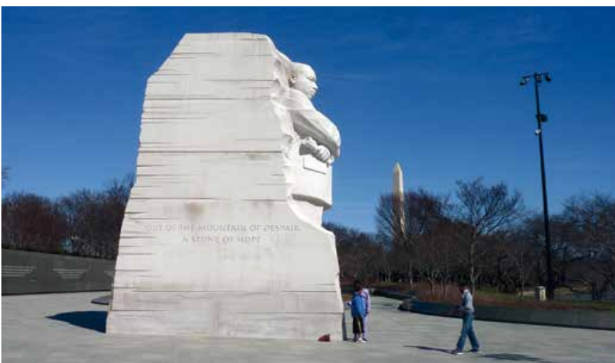
In 2011 werd het MLK Monument in Washington, D.C. onthuld

Al bijna direct na de moord op King in 1968, vier dagen om precies te zijn, klinkt de roep om de dominee en zijn boodschap voor gelijke rechten en behandeling voor en van de zwarte bevolking van de Verenigde Staten te eren met een nationale feestdag. Het idee stuit op veel verzet. Net als nu is het land verdeeld. Politiek, bedrijfsleven, maatschappelijk middenveld, alles en iedereen staat tegenover elkaar. De eerste staat die, in 1973, voor de King Holiday tekent is Illinois. Meerdere staten volgen en in 1979 vraagt president Carter aan het Congres