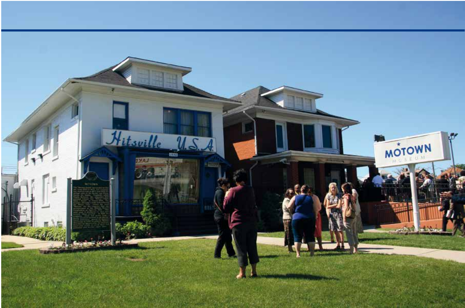
Motown Records lanceerde in 1962 de twaalfjarige Little Stevie Wonder